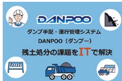
ダンブ手配・運行管理システム「DANPOO(ダンブー)」

DANPOO (ダンブー) は、建設現場で発生する『残土処分』を、オンライン上で管理できる建設会社とダンブのプラットフォームです。現場にダンブを最適配車する『DANPOO (ダンブー)』は、オンライン決済の機能や、帳票作成の機能など、様々な便利機能が備わっています。残土処分の見える化・効率化を進めています。昨年度に実施した「由良川夏間地区河道掘削他工事」において、効率面では、運土工程が当初の計画値27日に対して、23日で完了し、運土工期を約14.8%短縮できました。また、安全面では、建設残土のトレーサビリティの強化に貢献致します。