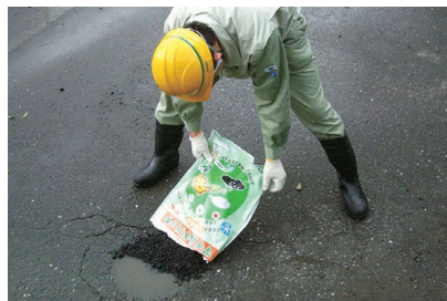
マイルドパッチ (20kg袋、10kg袋)