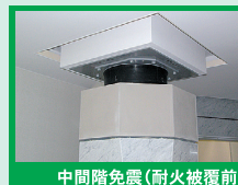
中間階免震(耐火被覆前)